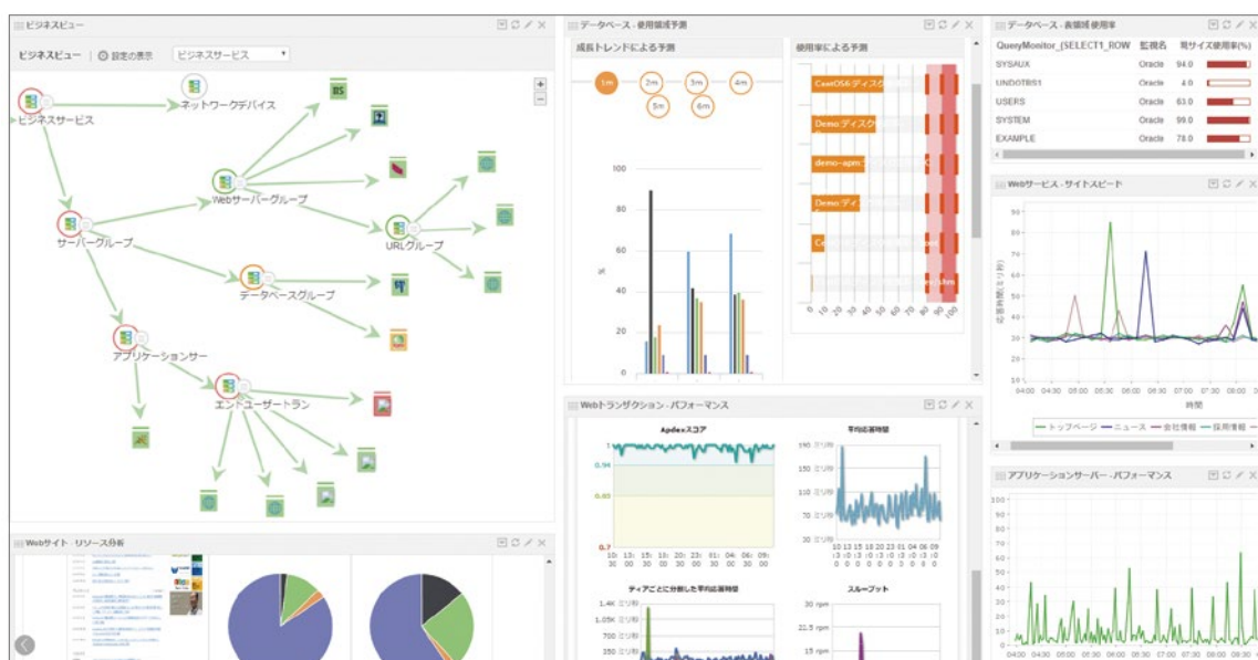
ダッシュボード画面

ManageEngine Applications Manager(マネージエンジン アプリケーションズ マネージャー)は、アプリケーションの可用性を適切に管理し、ビジネス損失の軽減、運用工数の削減を実現するソフトウェアです。今日のビジネスのライフラインとなっているWebシステムを統合監視し、効率的かつタイムリーに状態を把握、安定稼働のための予防保全や障害対応を支援します。