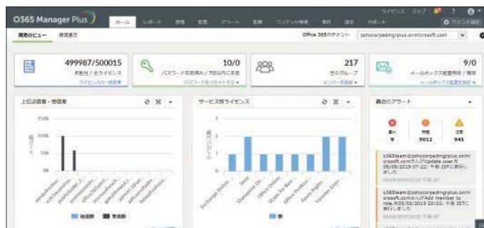
O365 Manager Plus ダッシュボード画面

監査・監視・管理・アラートを含めた Microsoft 365 に関する情報を 1 つのコンソールに集約しています。複数のブラウザを開くことなく、数クリックで必要な情報に辿り着きます。見つからない場合は、機能を検索欄から探すこともできます。特に利用頻度の高いレポートやアラートは、ダッシュボードに加えておくことで一目で確認可能です。