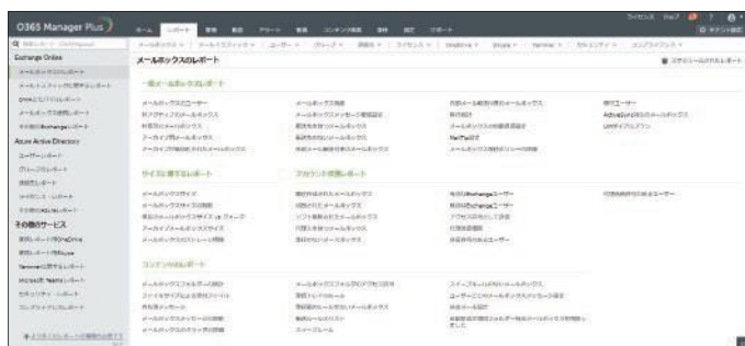
O365 Manager Plus レポート一覧画面

700種類以上の定義済みレポートを自動出力できます。監査およびオブジェクトの棚卸を行うことで Microsoft 365 の現状を把握し、セキュリティリスクを発見できます。