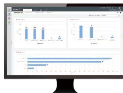
統合されたコンソール画面で表示