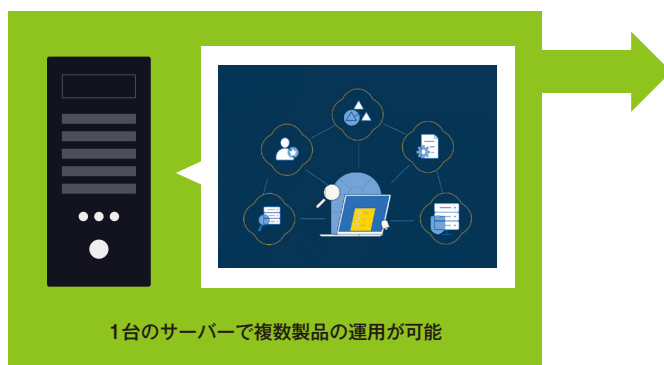
1台のサーバーで複数製品の運用が可能

製品を個別に導入する場合、製品ごとにサーバーを用意する必要がありました。しかしLog360では、複数製品の機能を1台のサーバーで管理することができ、サーバーコストを削減します。