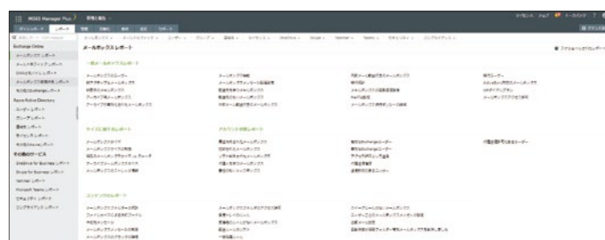
M365 Manager Plus レポート一覧画面

700種類以上の定義済みレポートを自動出力できます。監査およびオブジェクトの棚卸を行うことで Microsoft 365 の現状を把握し、セキュリティリスクを発見できます。